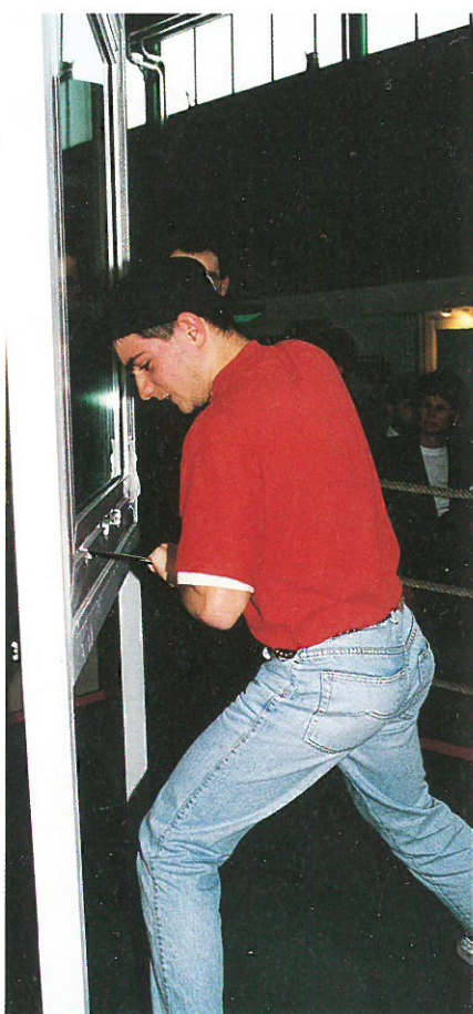
Nella foto tentativo di scasso su serramento dotato di accessori antieffrazione effettuato durante il SAIEDUE di Bologna dello scorso marzo.